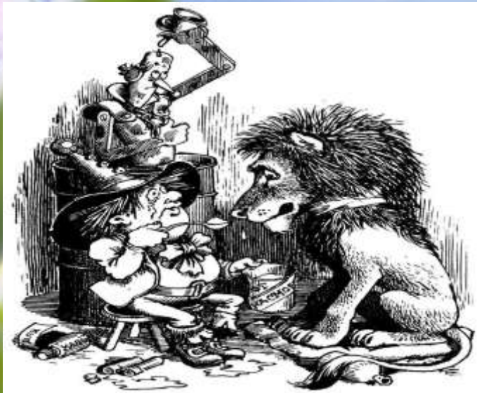
ИЛЛЮСТРАЦИЯ (от лат. - освещение, наглядное изображение) – объяснение, истолкование с помощью наглядных примеров или образцов. И обычно называется изображением служащее наглядным пояснением или дополнением какому-либо тексту. Иллюстрация литературных произведений, раскрывающая их содержание в художественных зрительных образах, является важным самостоятельным видом, изобразительного искусства. Иллюстрация органически входит в общее художественное оформление книги, журнала газеты, наряду с декоративными элементами (заставка, концовка, инициалы).