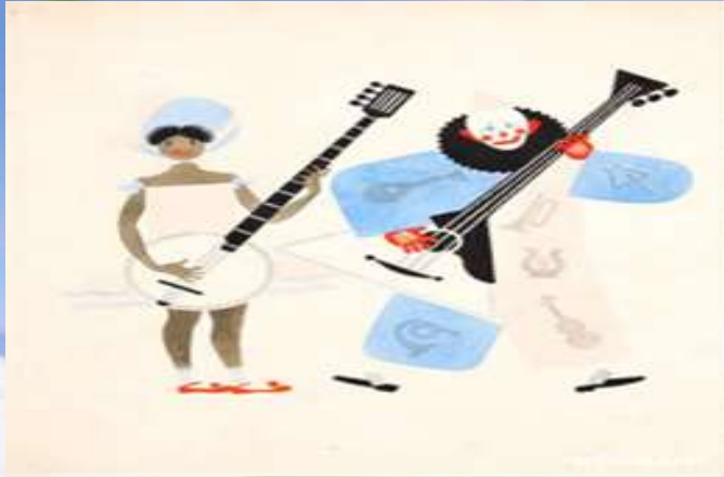
Рис. Владимир Васильевич Лебедев