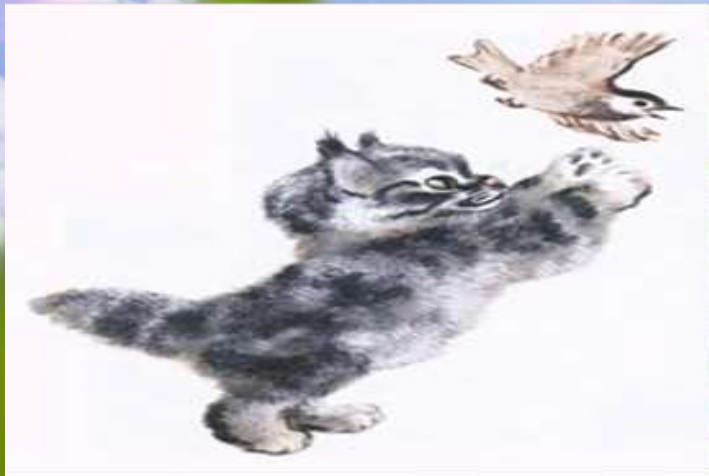
Рис. Евгений Иванович Чарушин