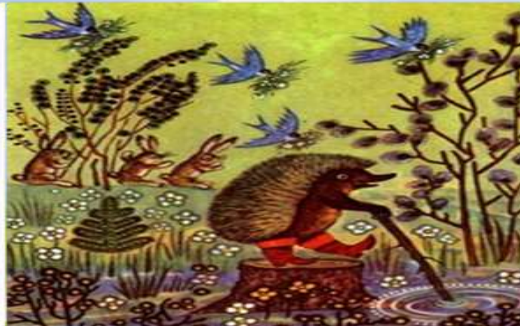
Рис. Юрий Алексеевич Васнецов